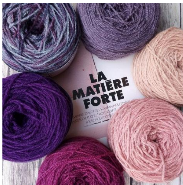
Fingering (aiguilles 2.5/3)